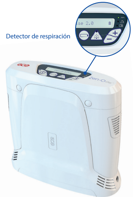
Detector de respiración

El Zen-O lite ™ es confiable y fácil de operar desde su pantalla digital y viene acompañado con un cómodo kit de transporte para asegurar que el paciente pueda continuar con una vida activa y sin restricciones.