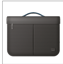
37304 Bolso de viaje 37305 Bolso de viaje para Ella