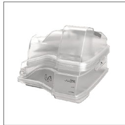
Humidificador calefaccionado HumidAir 37300 Contenedor lavable 37299 Contenedor estándar