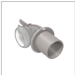
37310 Salida de aire (conecta el dispositivo y el tubo; desinfectela o reemplázela para el uso con más de un paciente)