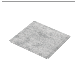
Filtros estándares 36850 (1 pk) 36851 (2 pk) 36852 (12 pk) 36853 (50 pk) Filtros hipalergénicos 36855 (1 pk) 36856 (2 pk) 36857 (12 pk) 36858 (50 pk) Tapa del filtro 19768 Gris (AutoSet for Her, AirCurve) 19729 Gris oscuro (CPAP, Elite, AutoSet)