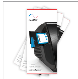
Carpeta protectora de tarjeta SD 37329 con tarjeta (10 pk) 37330 sin tarjeta (10 pk) 36931 lector de tarjeta SD