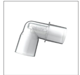
37394 Codo para tubos Air10 (codo alineado para uso con tubos no calefaccionados)