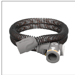
37296 Tubo calefaccionado ClimateLineAir 37357 Tubo calefaccionado ClimateLineAir Oxy 36810 Tubo SlimLine™