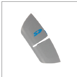
Puerta de caucho del panel lateral para la tarjeta SD 19766 Gris (AutoSet for Her, AirCurve) 19728 Gris oscuro (CPAP, Elite, AutoSet)