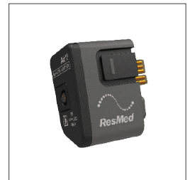
37302 Módulo de oximetría Air10 22374 Oxímetro XPOD 22371 Broche para XPOD 707560 Sensor blando reutilizable (medio) con cable de 3 metros 370004 Kit completo de oximetría Air10: incluye el módulo de oximetría, el XPOD, el broche para XPOD y el sensor blando reutilizable (medio)